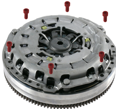
Abb./Fig. 2: Kupplung montieren / Install clutch / Monter l'embrayage / Montar l'embrague / Montaggio della frizione