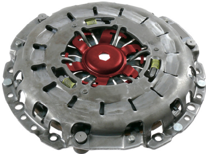
Abb./Fig. 1: Selbstnachstellende Kupplung mit Verriegelungsstück / Self-adjusting clutch with clutch locking piece / Embrayage à rattrapage automatique avec pièce de verrouillage / Embrague autorregulador con pieza de bloqueo enclavamiento / Frizione autoregistrante con elemento di bloccaggio